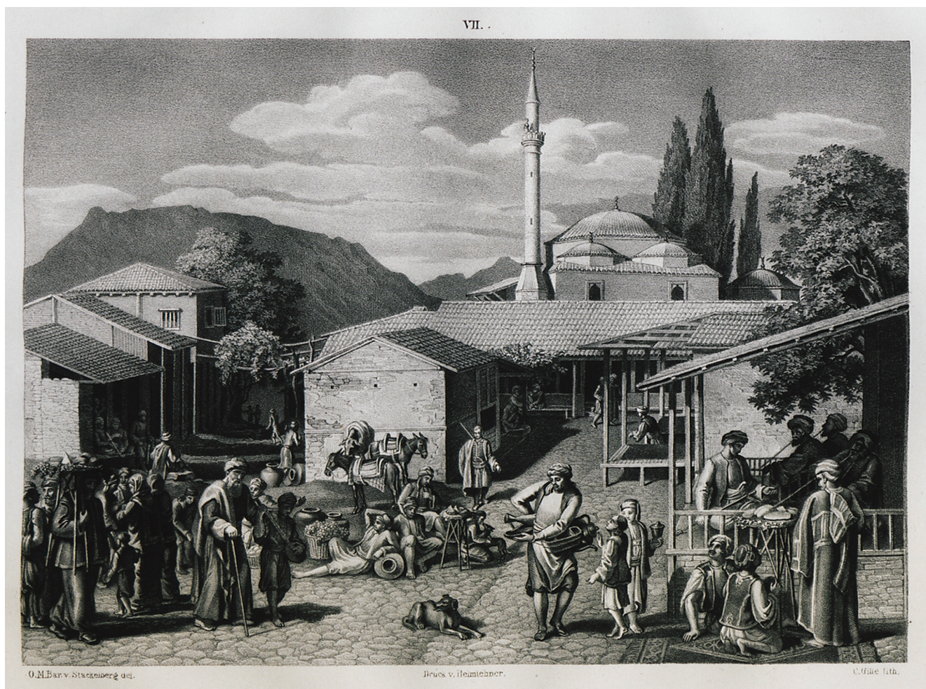
«Παζάρι στην Κόρινθο», Stackelberg, Otto Magnus von. Trachten und Gebräuche der Neugriechen , Βερολίνο, G. Reimer, 1831, Γεννάδειος Βιβλιοθήκη - Αμερικανική Σχολή Κλασικών Σπουδών στην Αθήνα, ανακτήθηκε από: Travelogues.gr

Στο συνέδριο θα δοκιμαστούν προτάσεις νέων θεματικών πεδίων και νέων μεθοδολογικών εργαλείων, η αξιοποίηση άγνωστων αρχειακών πηγών και άλλων ιστορικών τεκμηρίων, η ανάδειξη των επιπτώσεων της Επανάστασης στη μετέπειτα οικονομική πορεία της χώρας, η συνθετική προσέγγιση και η κατανόηση του παρελθόντος. Τέλος, επιδίωξη του συνεδρίου αποτελεί η συνολική ανάλυση της οικονομίας στα χρόνια της Επανάστασης, όπως καταχρηστικά μπορεί να προσδιοριστεί η περίοδος μέσα από τις συνέχειες και ασυνέχειες της οθωμανικής και της διεθνούς οικονομίας που προσδιόρισαν και τη νέα εθνική οικονομία.