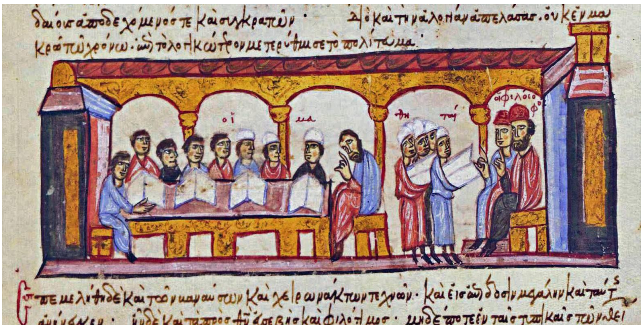
Σκηνή διδασκαλίας στο Βυζάντιο. Χρονικό του Ιωάννη Σκυλίτζη (12ος αι.) Μαδρίτη, Εθνική Βιβλιοθήκη